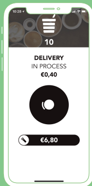
AUSGABE WIRD VORBEREITET